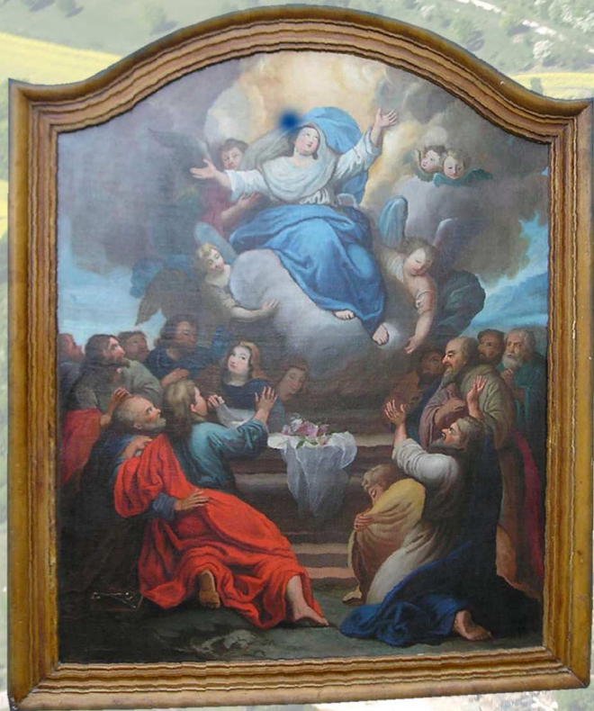
L'Assomption de la Vierge

L' Eglise de l'Assomption de Rupt-en-Woëvre date de 1744. Elle fut endommagée durant la Première Guerre Mondiale et a été restaurée depuis. En visitant cet édifice, découvrez le tableau représentant l'Assomption de la Vierge, une huile sur toile peinte par un anonyme du XVIIIème siècle. Ce tableau est inscrit à l'Inventaire Supplémentaire des Monuments Historiques depuis le 30 Janvier 2004, tout comme l'ostensoir, les autels et retables latéraux et les bancs de la nef.